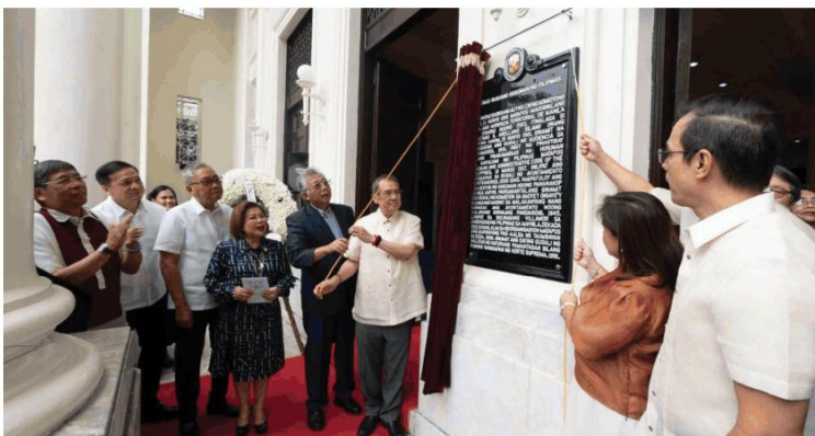
MANILA, Philippines — The Supreme Court of the Philippines officially unveiled a historical marker from the National Historical Commission of the Philippines (NHCP) on June 5, 2026, at the Supreme Court New Building in Padre Faura, Manila, as part of the celebration of the Court's 125th Anniversary.